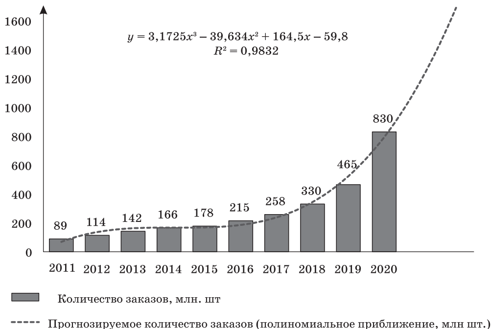
Рис. 1. Количество заказов, совершенных через интернет Fig. 1. Number of orders made via the Internet

Можно предположить, что наличие подобной рамки, в совокупности с ранее обозначенными стимулами в виде эффективности использования цифровых платформ, может подталкивать предпринимателей к ведению бизнеса в легальном поле. Однако для ее эмпирического подтверждения или опровержения необходимо наличие статистической информации об изменениях ненаблюдаемой экономики,